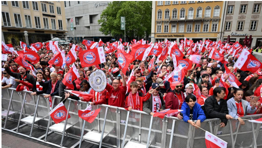
Beleidigung auf großem Plakat

Schwerer Autounfall auf Föhr – Rettungshubschrauber landet auf L214