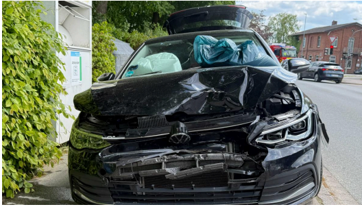
Frontalcrash auf Kreuzung

Unfall auf der B207: Warum der Großalarm für ein Kind und drei Erwachsene glimpflich ausging