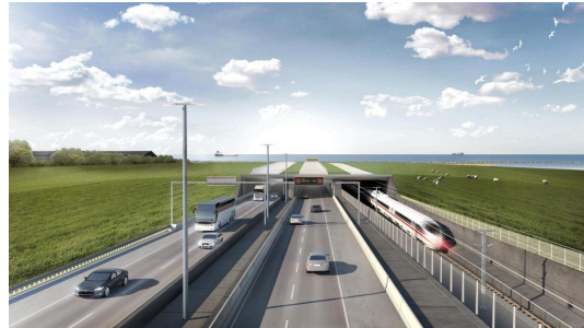
Wegen deutscher Verzögerungen

Schmähkritik auf Bayern-Meisterfeier: Wer für das XXL-Banner verantwortlich ist